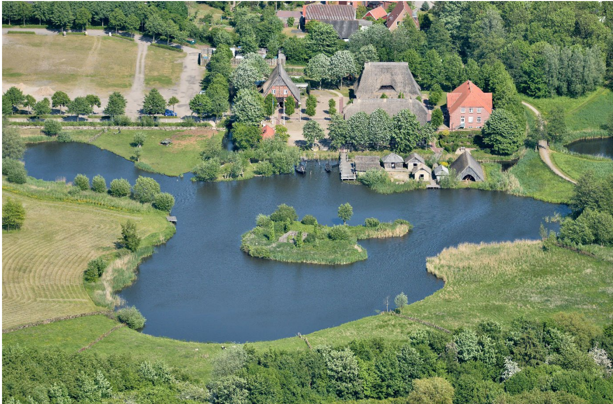
(Luftbildaufnahme vor der inzwischen erfolgten Erweiterung)